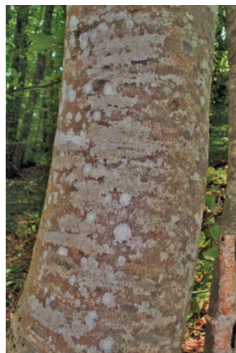
Tronco del faggio

Descrizione: il Faggio ( Fagus sylvatica L.) appartiene all'Ordine delle Fagales , Famiglia delle Fagaceae , quest'ultime comprendono alberi e arbusti decidui e sempreverdi, per un totale di circa 1000 specie, ripartite tra 7 generi, il più grosso e diversificato dei quali è Quercus . Il Faggio è il più importante costituente dei boschi di latifoglie del piano montano. Boschi di faggio ad alto fusto o cedui ricoprono la parte boschiva dei nostri monti dagli 800 m sino ai pascoli sommitali. Lo troviamo in formazioni pure od associato ad abeti, pini, tasso, frassino maggiore, olmo montano, aceri, sorbi, ciliegio selvatico, carpini, fino a 1400-1800 m di altitudine. La specie a distribuzione strettamente montana, predilige clima temperato ed esige ambienti freschi. Vegeta in maniera ottimale in zone con una temperatura media annua di 6-12°C e precipitazioni intorno a 1500 mm/anno. Teme anche aridità (limite