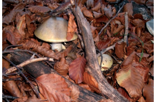
Amanita phalloides in faggeta d'autunno

triangolare, avvolta da una cupula legnosa e spinosa, munita di aculei non pungenti, che a maturità si apre in 4-5 valve lasciando disperdere due o tre frutti per cupula.