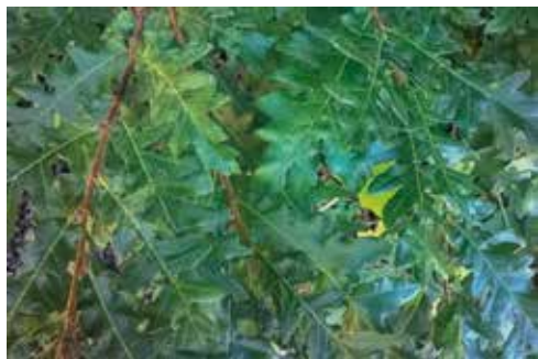
Foglie di Cerro con lamina superiore lucida