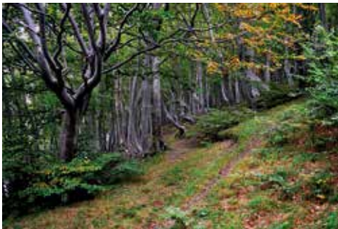
Faggeta nei Sibillini

Sono molte le specie da vedere e osservare con attenzione, impossibile elencarle tutte in queste poche righe, pertanto ci limiteremo a descriverne alcune tra le commestibili più comuni e di facile riconoscimento reperibili negli ambienti sopra citati.