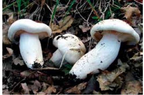
Hygrophorus penarius “galluccio bianco”

ne possono fare delle abbondanti raccolte in quanto crescono a gruppi di numerosi esemplari; fungo completamente bianco-avorio con leggera sfumatura rosata al centro del cappello che può raggiungere anche i 15 cm di diametro, lamelle decorrenti, spesse e spaziate, gambo sodo e carnoso come pure la carne che è bianca e con un caratteristico profumo di “latte bollito”, anche questa specie oltre al consumo immediato si presta egregiamente alla conservazione sott’olio.