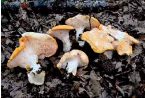
Hydnum repandum “steccherino, pelosella”