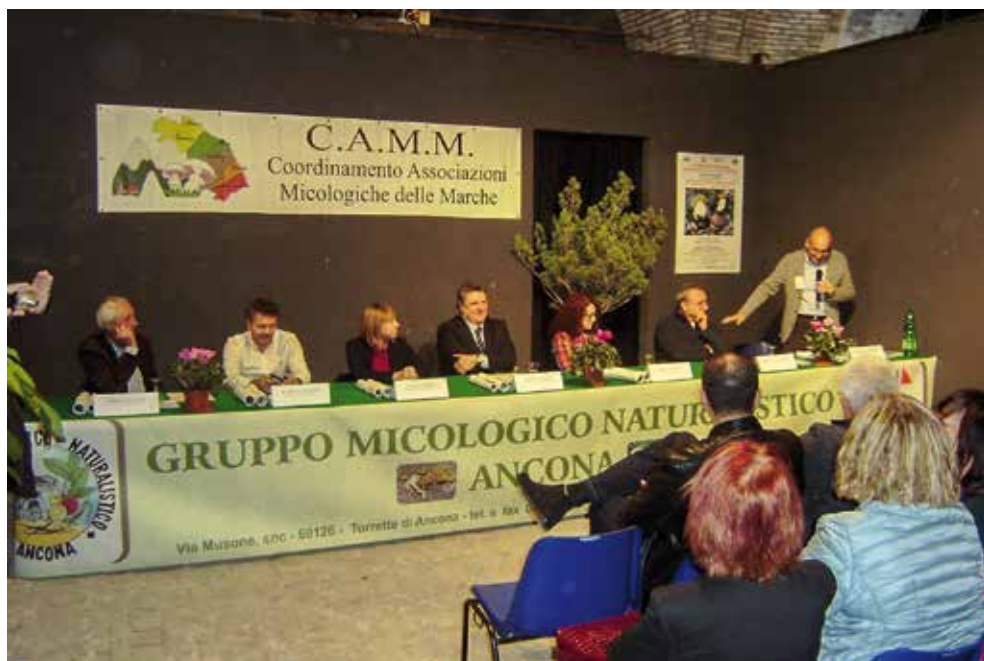
Saluto del Presidente del CAMM all'inaugurazione della Mostra Regionale

In anticipo rispetto alla data tradizionale di fine ottobre, si é tenuta dal 17 al 20 ottobre 2015 la quattordicesima edizione della Mostra Regionale di Micologia, Piante ed Erbe Ufficiali “Città di Ancona”.