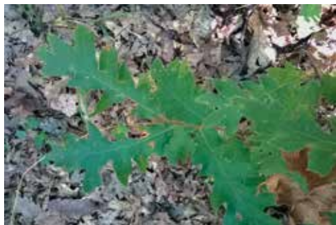
Le foglie con lobi molto incisi

Osservazioni: specie mesofila (teme gelate e siccità), predilige suoli profondi, freschi, anche argillosi, si spinge fino ai 1100 m S.l.m. insinuandosi nelle faggete in esposizioni più calde. Tre settori preferenziali nelle Marche: substrati marnoso-arenacei (Val Marecchia e Serre di Burano), substrati carbonatici della dorsale appenninica (dall'alto Esino alla valle del Chienti, nelle valli del Potenza e del Nera), nuclei sul