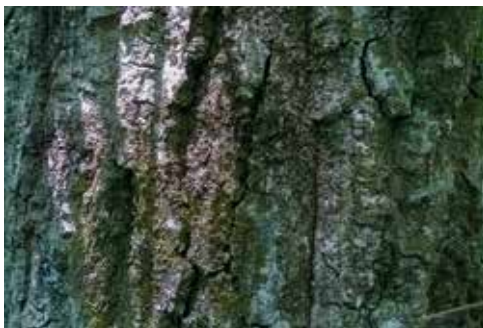
Particolare della corteccia