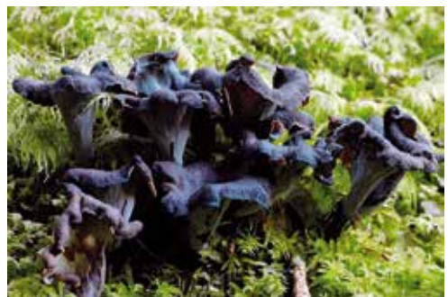
Craterellus cornucopioides "trobetta dei morti"

Contrariamente al suo nome volgare che la vorrebbe far crescere ai primi di novembre, questa specie si può trovare già dalla fine di settembre nelle zone ombrose e umide