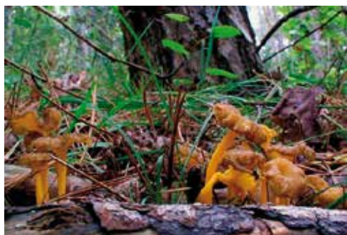
Craterellus lutescens "finferla"

Il fungo ha una forma imbutiforme, cappello ombelicato di color bruno-arancio con margine sinuoso, imenoforo formato da pieghelette di colore giallo-aranciato a volte sfumato di rosa salmone, gambo lungo, di forma irregolare, compresso, cavo all'interno, di colore giallo-arancio, carne sottile, elastico-fibrosa, giallastra con buono e forte odore fruttato, sapore dolce.