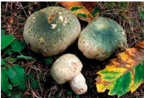
Russula virescens "verdone"

Gli esemplari giovani e sani sono ottimi da fare in insalata, tagliati a fettine sottili e conditi con olio extra vergine di oliva, scaglie di parmigiano e qualche goccia di limone. Russula dal cappello a lungo globoso poi emisferico con la cuticola inizialmente quasi bianca tendente a maturità a divenire verde acqua marina e a screpolarsi in caratteristiche areole che lasciano intravedere la sottostante carne bianca, lamelle bianche con qualche macchia ocra-ruggine, gambo duro e pieno da giovane poi molle e spugnoso, carne soda e dolce; è una delle pochissime Russula che si possono mangiare crude in insalata purché siano esemplari giovani e sani.