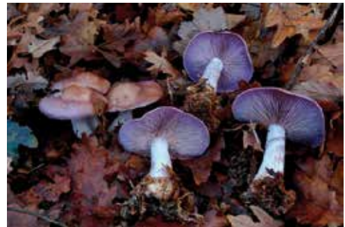
Lepista nuda “violetto”

Prima che inizino a cadere le foglie in questi ombrosi boschi è possibile fare delle belle raccolte di Lepista nuda (Bulliard) Cooke che cresce spesso in gruppi numerosi tra lo strato di foglie.