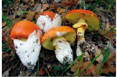
Amanita caesarea "ovolo buono, cocchi"

All'inizio tutto il fungo è avvolto da un velo generale formato da una membrana bianca che lo fa somigliare a un uovo sodo, poi con lo sviluppo del carpoforo questo velo si lacera nella parte alta facendo intravedere un bel cappello giallo-arancio vivo mentre il resto del velo rimane alla base del gambo come un sacchetto inguainante chiamato volva.