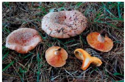
Lactarius deliciosus “sanguinello, sanguinaccio”

emette un lattice color arancio vivo e di sapore mite.