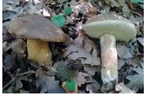
Boletus aereus