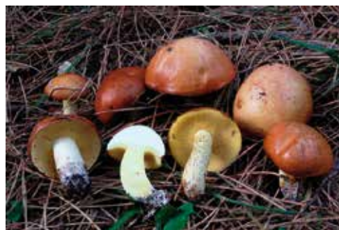
Suillus granulatus "pinarolo"

Ottima specie commestibile si può essiccare facilmente (acquista più aroma) e poi far rinvenire a bagno con il latte e utilizzare assieme alle carni o in sugo per polenta. Si può dire che non esista una pineta di pino nero che non sia colonizzata dai Suillus , in quanto i rimboschimenti forestali vengono effettuati con piantine già micorizzate con il micelio di queste specie il che garantisce un attecchimento più veloce e sicuro del nuovo impianto.