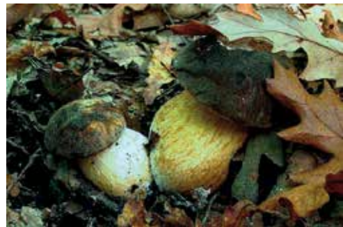
Boletus aereus "porcino nero, bronzino"

del cappello, carne soda bianca immutabile di sapore dolce e odore leggero di nocciola. Esemplari giovani e sani sono ottimi fatti a fettine in insalata, essiccati acquistano molto in aroma.