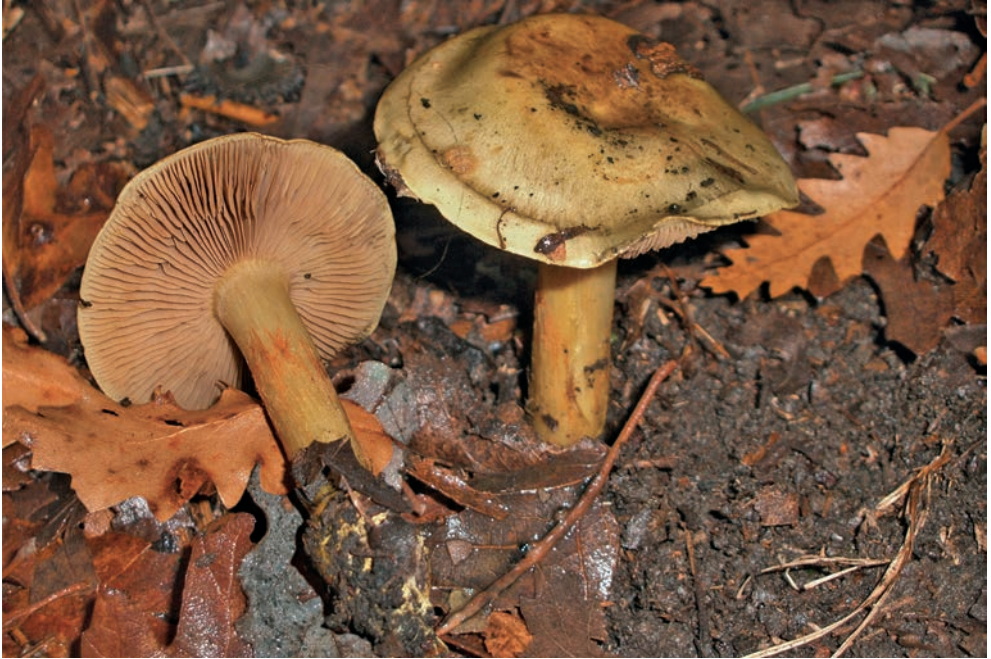
Cortinarius odoratus var. suavissimus