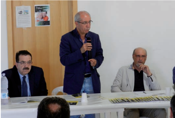
Il saluto del Sindaco di Mondolfo

questo editoriale sarà quasi tutto dedicato alla manifestazione dell'8 giugno a Marotta, progettata e realizzata al fine di dare un riconoscimento ai micologi ricercatori delle Marche che in questi anni, con passione ma con evidente spirito di sacrificio, hanno contribuito alla redazione di contenuti di carattere scientifico finalizzati a delineare il profilo della nostra amata rivista "Micologia nelle Marche".