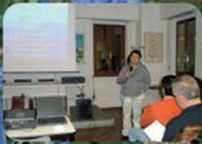
Corsi per Patentini raccolta funghi