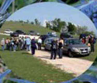
Uscite in natura