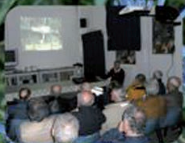
Relazioni in Sede con i ns Micologi